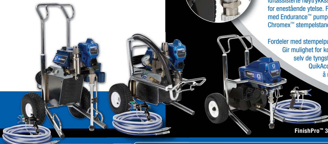
FinishPro™ 395 - FinishPro™ 390 - FinishPro™ 290